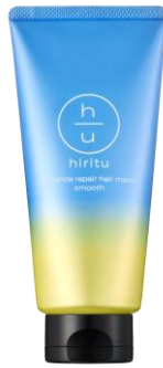
ヒリツ バランスリペアヘアマスク スムース ¥1,540(税込) / 180g