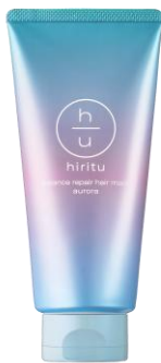
ヒリツ バランスリペアヘアマスク オーロラ ¥1,650(税込) / 180g