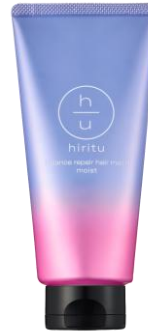
ヒリツ バランスリペアヘアマスク モイスト ¥1,540(税込) / 180g