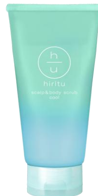
ヒリツ スカルプ&ボディ スクラブ クール