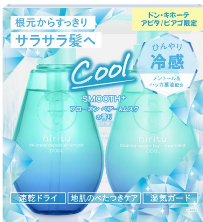
ヒリツ バランスリペア クール リミテッドセット