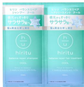
ヒリツ バランスリペア シャンプー&トリートメント クール 2連サシェ